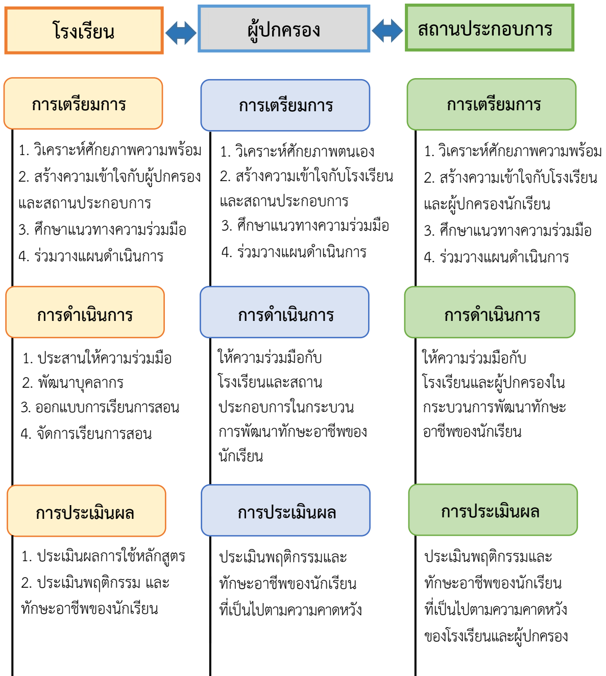
ภาพที่ 1 กรอบในการขับเคลื่อนการจัดการศึกษาเพื่อพัฒนาทักษะอาชีพนักเรียนของสถานศึกษา เฉพาะความพิการ